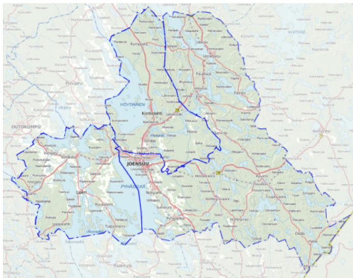
Kuva 1: Joensuun toimivaltainen viranomaisen