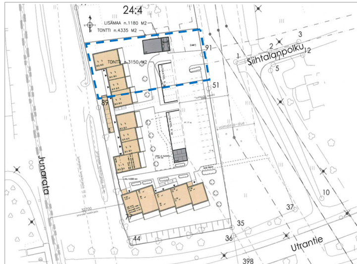
Alustava tontinkäyttösuunnitelma. Laajennusrajaus sinisellä katkoviivalla.