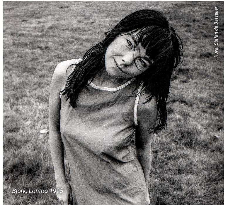
Björk, Lontoo 1995

Pohjois-Karjalan museo Hilma Koskikatu 5, Carelicum, Joensuu ma-pe 10-17, la-su 10-15 pääsymaksut: 3/5 € www.pohjoiskarjalanmuseo.fi