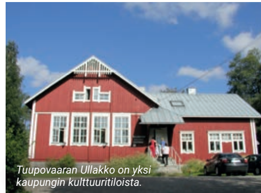
Tuupovaaran Ullakko on yksi kaupungin kulttuuritiloista.