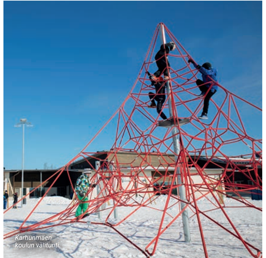
Karhunmäen koulun välitunti.

www.joensuu.fi/hiilineutraali-joensuu-2025