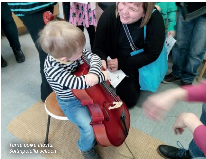
Tämä poika ihastui Soitinpolulla selloon.