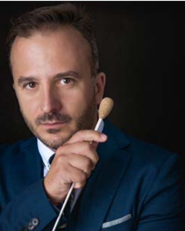
Konsertin kapellimestari Huba Hollókői.