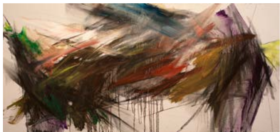
📷 Reijo Turunen, Hiilinielu suo , 2019

Taidemuseo on marraskuussa mukana myös Rokumentti -festivaalin