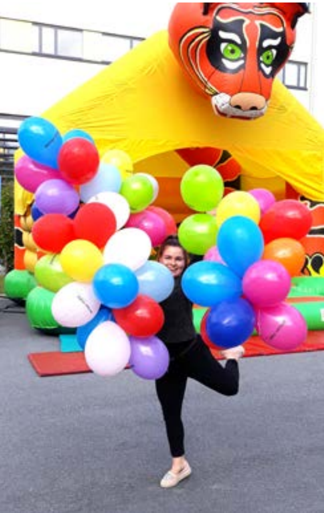
Opiston juhlavuosi alkoi iloisesti Juhlastartilla pomppulinnoineen, ja juhla jatkuu läpi lukuvuoden.