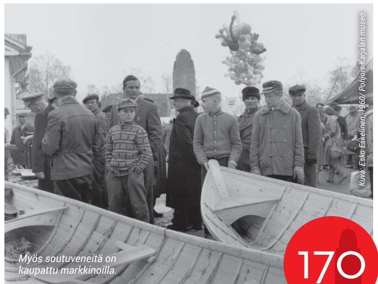
Myös soutuveineitä on kaupattu markkinoilla.

Museossa halutaan nostaa nämä rakastetut "heinätoritaiteen" antimet kunnia paikalle näyttelyyn. Jos haluat lainata omaa Taistelevaa metsoasi kaupungin juhlanäyttelyyn, ota yhteyttä Pohjois-Karjalan museoon puh. 050 351 8608 tai iiris.heino@joensuu.fi.