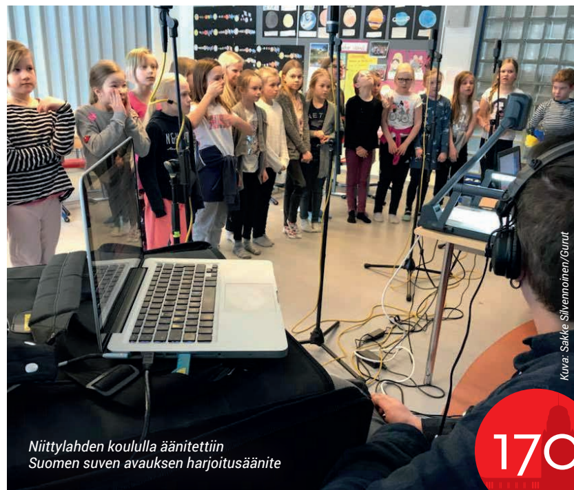
Niittylahden koululla äänitettiin Suomen suven avauksen harjoitusäänite

– Kuoro perustettiin eri kouluista kootuista lapsista. Siinä meillä on kuoro valmiina Joensuussa. Syksyllä se jatkaa kansalaisopiston kuorona, johon kuka tahansa lapsi saa tulla laulamaan.