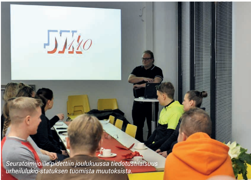
Seuratoimijoille pidettiin joulukuussa tiedotustilaisuus urheilulukio-statuksen tuomista muutoksista.