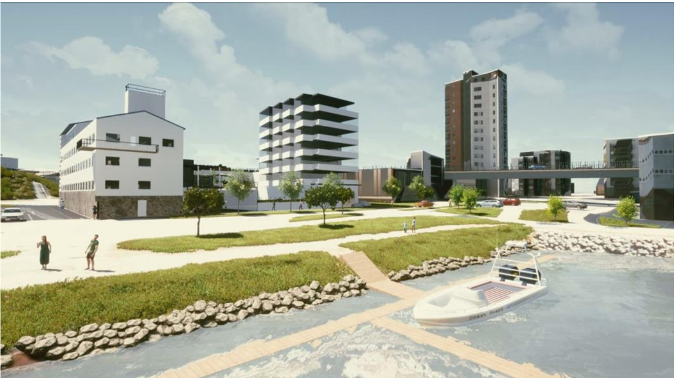
Havainnekuva – Joensuun kaupunki

Tarjouskilpailun kohteena on Niinivaaran (5) kaupunginosan korttelin 502 tontti 11 rakennuksineen. Kohde sijaitsee osoitteessa Penttilänkatu 7-9, Suvantosillan kupeessa Pielisjoen itärannalla. Alueelle on laadittu asemakaavamuutos (KV 26.7.2022), jossa tontille on osoitettu rakennusoikeutta 5000 k-m 2 . Asemakaavassa kohde sijaitsee AL – asuin- liike-, ja toimistorakennusten korttelialueella.