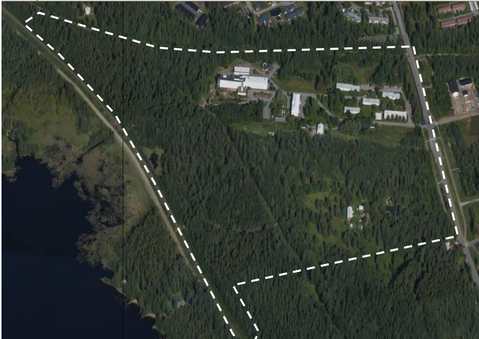
Muutosalueen likimääräinen raja (viistoilmakuva pohjoisesta)

Asemakaava koskee Joensuun Pielisensuun (401) kylän tiloja 30:24, 15:55, 15:75, 15:96, 15:97, 876:1 ja lunastusyksikköä 167-871-1-4 (Rataosa 1705) sekä katualueita.