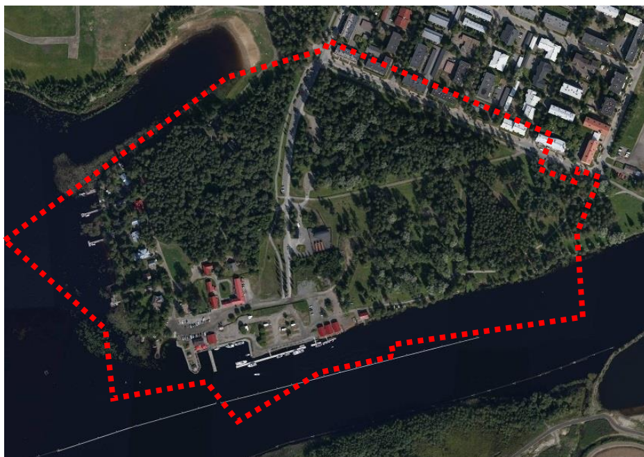
Muutosalueen likimääräinen rajaus

Asemakaavan muutos koskee Joensuun kaupungin Linnunlahden (17) kaupunginosan kortte- leita 1785, 17101 ja 17106, sekä liikenne-, virkistys- ja vesialueita sekä IV kaupunginosan kortte- leita 402 ja 403 sekä liikenne-, virkistys- ja vesialueita.