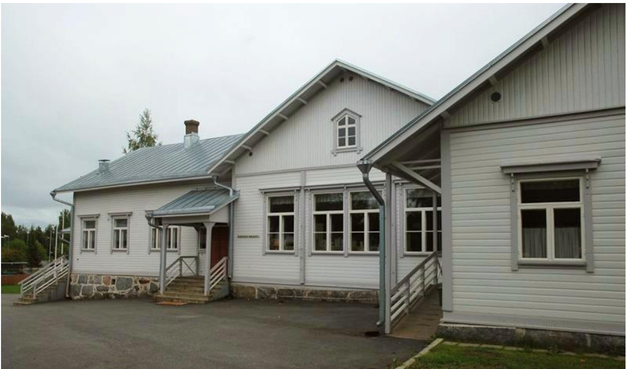
Vanha kirjastorakennus on rakennettu vuonna 1892.

Tontin vieressä sijaitsee päivittäistavarakauppa ja vuonna 2022 valmistunut Karsikon yhtenäiskoulu.