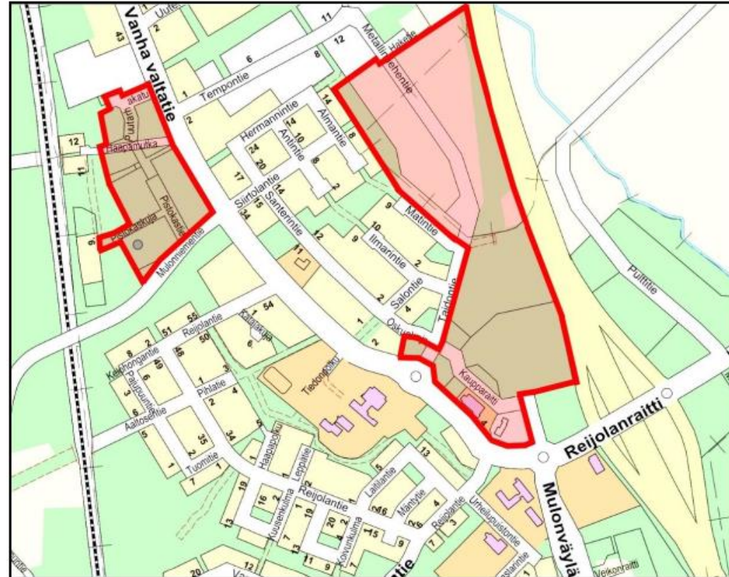
Kaava-alueiden sijainti opaskartalla