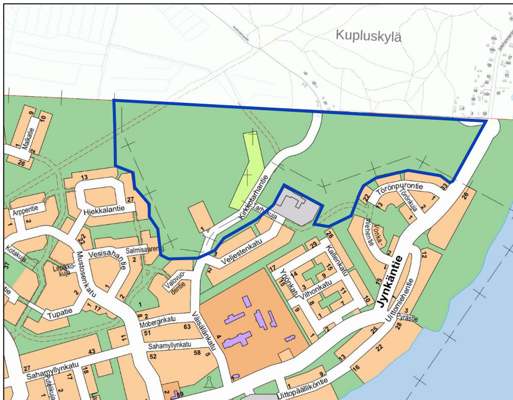
Kaava-alueen sijainti opaskartalla