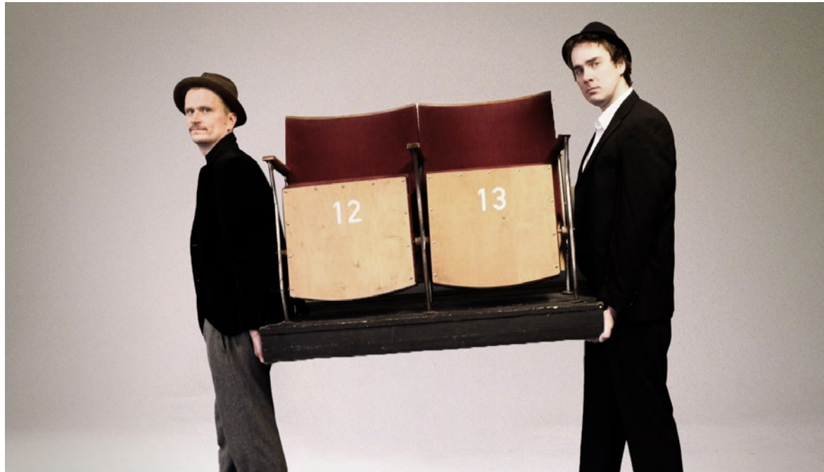
Pohjois-Karjalan kansanteatteri Pokan Minikesäteatteri esittää Samuel Beckettin (1906–1989) pantomiimin kahdelle näyttelijälle kolmessa eri kohteessa ympäri Joensuuta.

Pysähdy hetkeksi Onnenpyörän kysymyksen äärelle ”Mikä tekee sinut onnelliseksi?” Onnenpyörä on jokaiselle kokijalleen räätälöity henkilökohtainen taidelahja, joka tuodaan