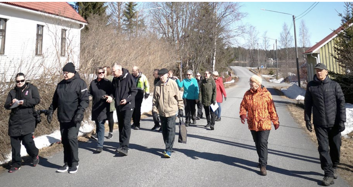
Enon pitäjäkatselmuksessa kerättiin porukalla toiveita ja kehitysideoita laidasta laitaan.

Joensuun kaupunki edistää osallisuutta uudenslaisin keinoin. Kuluneen kevään aikana kaupungin viranhaltijat eri toimialoilta ovat jalkautuneet yhdessä asukkaiden kanssa pitäjiin ja kiertäneet katsomassa kohteita, jotka asukkaiden mielestä olisivat kohennuksen tarpeessa.