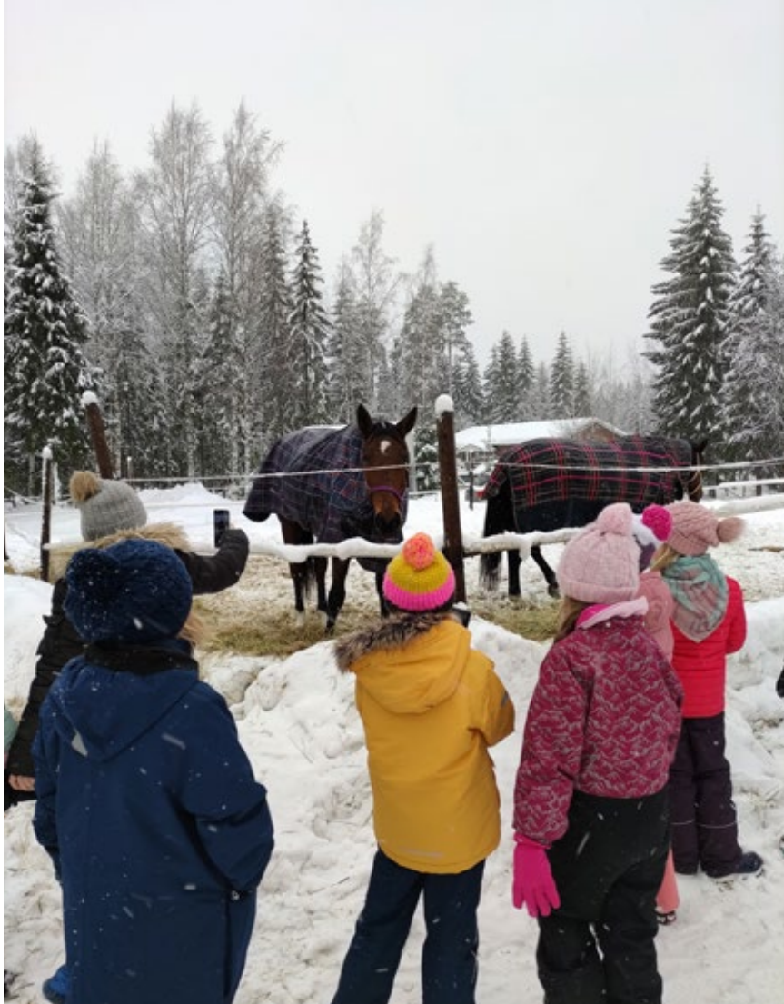
Erityisesti erilaiset eläinkerhot ovat olleet lasten mieleen.

Kerhokalenterista löytyy muun muassa parkouria, bändikerhoja, pelejä ja koodausta, kuvataidetta ja liikuntakerhoja.