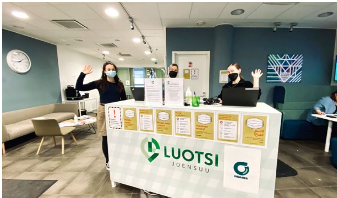
Luotsin palveluneuvojat ovat valmiina palvelemaan työllisyysasioissa niin silmätysten kuin etänäkin.

Luotsin yhteistyökumppanien edustajat ovat säännöllisesti tavattavissa palvelupisteellä, jonne voi tulla tapaamaan esimerkiksi eri oppilaitosten opinto-ohjaajia tai saada apua talouden hallintaan liittyvissä kysymyksissä Talousneuvolasta. Alle kolmekymppiset voivat tulla palvelupisteelle keskustelemaan Ohjaamon työntekijän kanssa työhön, koulutukseen tai arkeen liittyvissä asioissa.