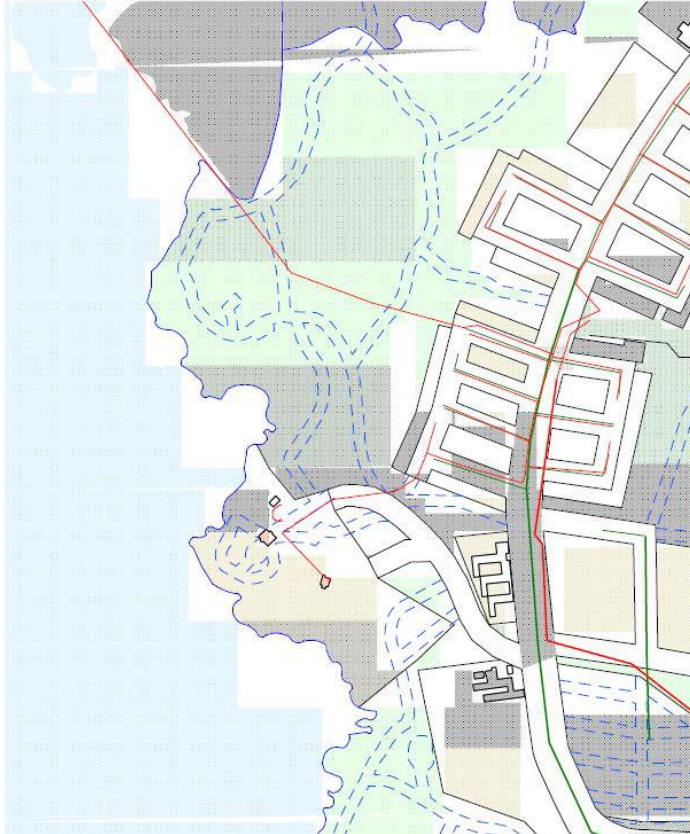
Kuva 1. Hulevesilinja on vihreä ja jätevesilinja on punainen