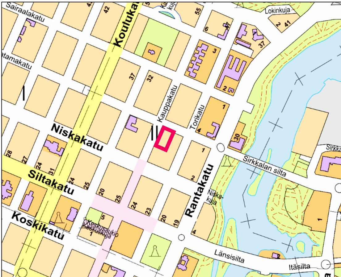
Kaava-alueen sijainti opaskartalla