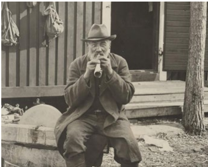
Tämä pillipiipari on taltioitu Pohjois-Karjalassa 1920–1930-lukujen tuiskeissa.

Ikääntyneille on tehty kaksi kuvakirjasta, joita voi hyödyntää muistelussa, uuden oppimisessa sekä ilahduttamassa arkea. Muistojen Pohjois-Karjalaa ja käden taitoja käsitteleviin kirjasiin on kerätty kuvamateriaalia menneiltä vuosikymmeniltä, runoilla ja sanannoilla ryödytettynä.