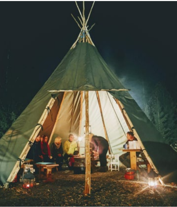
Karhunsalon kylätalon pihalle kyläyhdistyksen voimin nousseessa lapinkodassa on messevää makustella makkaraa ja nautiskella nokipannukahvit.