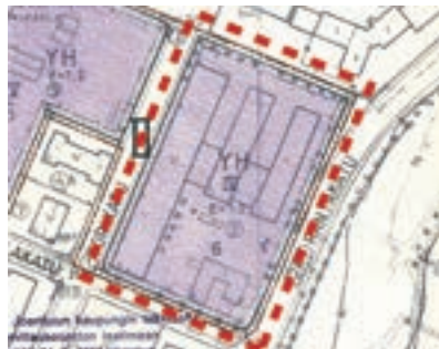
Ote voimassaolevasta kaavasta