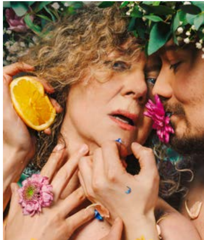
William Shakespearen alkuperäisteokseen pohjautuva Kesäyön unelma on 2020-luvun Ateenaan sijoittuva komediallinen satufantasia

Katso kaupunginteatterin kevään koko ohjelmisto: www.joensunteatteri.fi