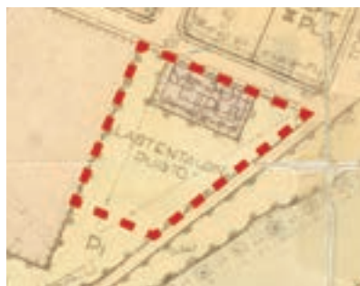
Ote voimassaolevasta kaavasta