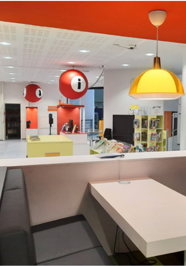
Uusittuun lasten ja nuorten osastoon voit tutustua myös Vaara-kirjastojen YouTube-kanavalla.