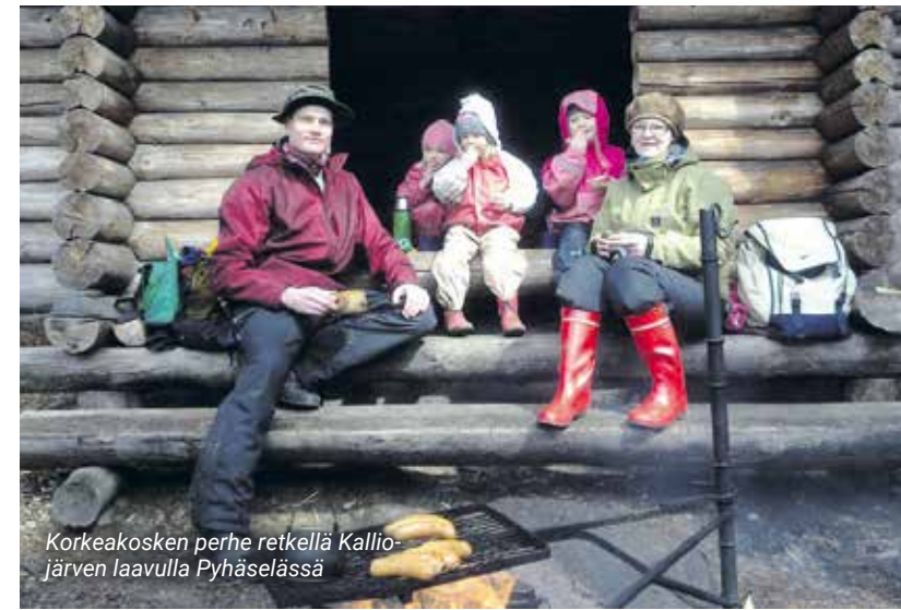
Korkeakosken perhe retkellä Kalliojärven laavulla Pyhäselässä