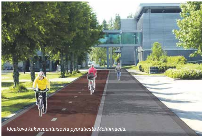
Ideakuva kaksisuuntaisesta pyörätiestä Mehtimäellä.