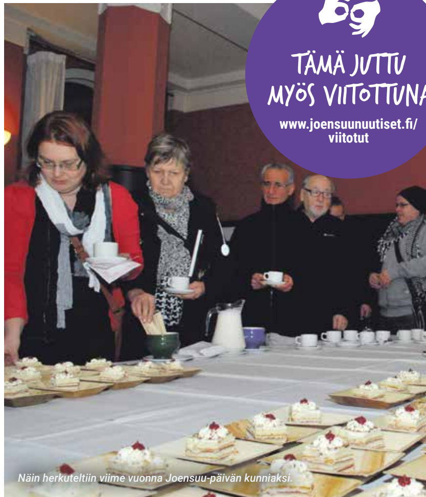
Näin herkuteltiin viime vuonna Joensuu-päivän kunniaksi.

Joensuu-päivän juhlinnan voi halutessaan aloittaa jo lauantaina 26. marraskuuta Sinkkolan Joulu -tapahtumassa kello 10–13. Luvassa on joulupuuroa, ponikyttä, askartelupiste ja jouluihin navetta.