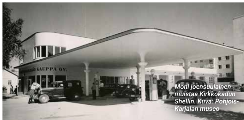
Moni joensuulainen muistaa Kirkkokadun Shellin.

Näyttelyyn voi tilata yleisöopastuksia 1.6. alkaen.