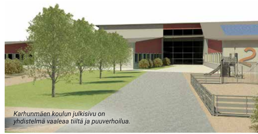
Karhumäen koulun julkisivu on yhdistelmä vaaleaa tiiltä ja puuverhoilua.